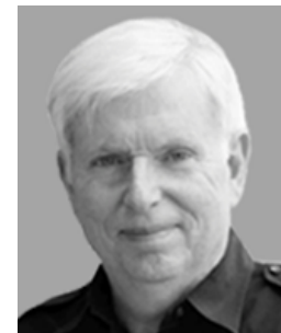
W. Edwards Deming