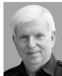
W. Edwards Deming